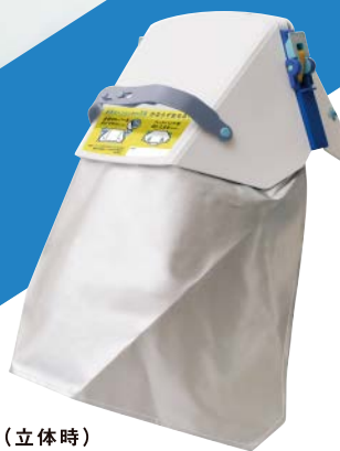
本体背面（立体時） ・ずきん部は後頭部のみを覆う仕様。

タタメツズキン2をベースに、機能とコストバランスをリーズナブルに見なおした普及版発売。